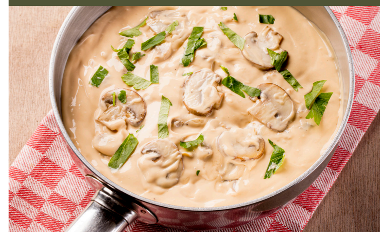
Archiducsaus , hier afgewerkt met extra gebakken champignons en platte peterselie Sauce archiduc , fini ici avec extra champignons cuits ten persil plat 10720450 – 46 ports. – 2,3kg