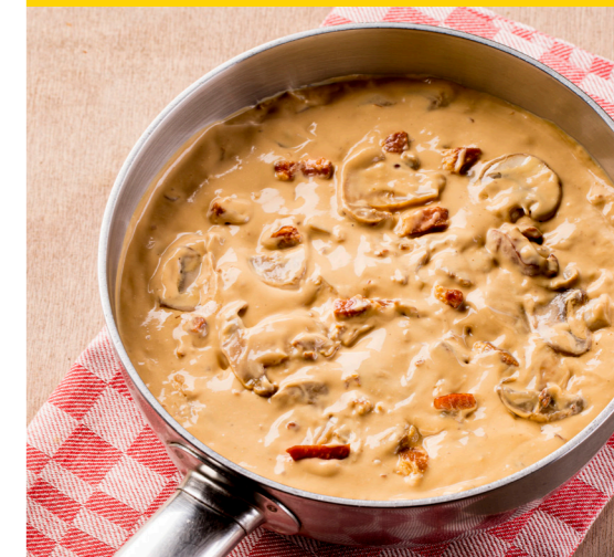
Jagersaus , hier afgewerkt met extra gebakken kastanjechampignons Sauce chasseur , fini ici avec champignons châtaignes cuits 10721050 – 46 ports. – 2,3kg