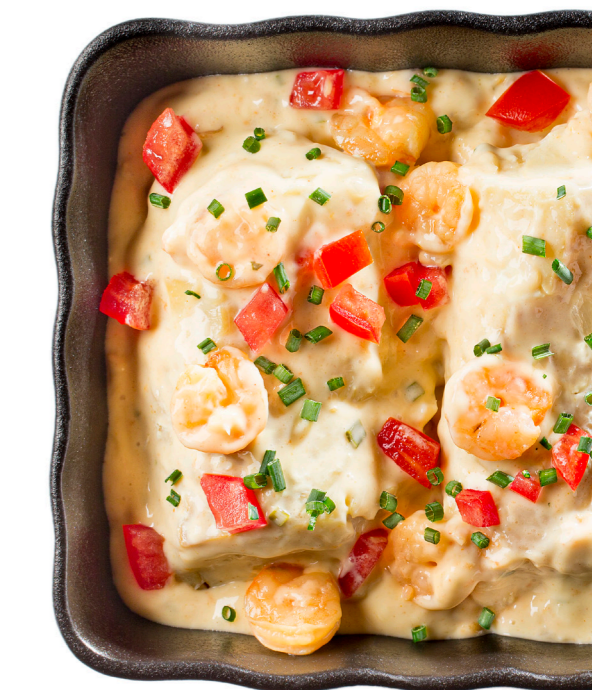
Atlantisch kabeljauwhaasje met tomaat en garnalen Cœur de cabillaud atlantique avec tomates et crevettes 10712780 - 11 ports. - 3kg