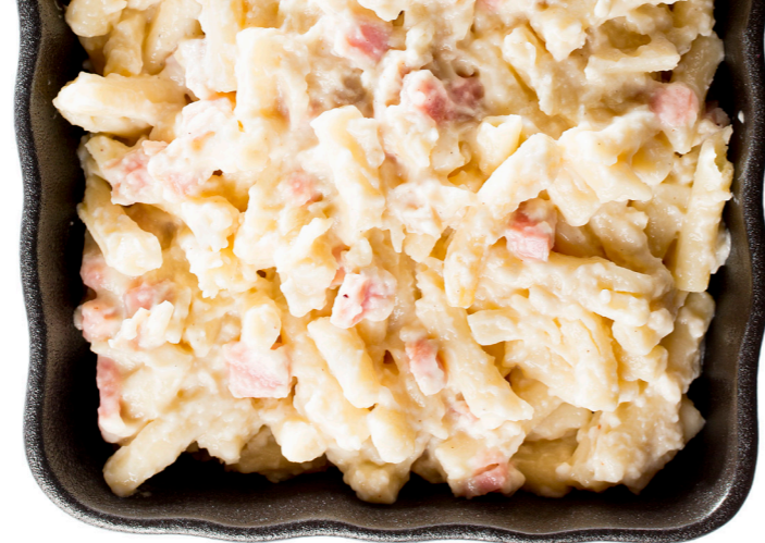
Macaroni ham & kaas Macaroni jambon & fromage 10713980 - 7 à 8 ports. - 3kg

Servir un plat savoureux n'est pas toujours facile. Chez Maiski, nous en faisons une évidence. Notre mission est d'utiliser notre gamme de plats cuisinés pour offrir chacun un moment savoureux. Notre gamme de plats savoureux à base de volaille, de viande et de poisson offre toujours un moment délicieux qui titille les papilles gustatives.