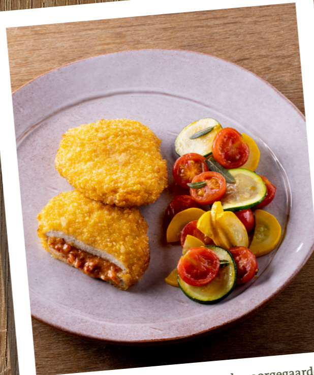
Kip tomaat mozzarella , gepaneerde voorgegaarde kip met gedroogde tomaten, mozzarella en basilicum. Poulet tomate mozzarella , poulet pané, précuit, farci de tomates séchées, mozzarella et basilic. 10835320 — 125 g st/pc — 2 x 12 st/pc — 3kg 10835220 — 125 g st/pc — 8 x 2 st/pc — 2kg