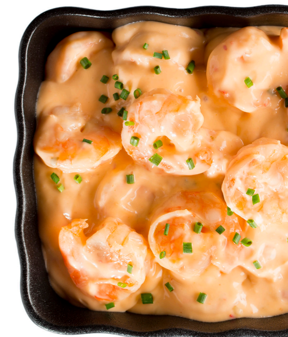
Scampi in een zacht duivelsausje (± 110 st) Scampi à la diable (± 110 pcs) 10715480 - 10-12 ports. - 3kg