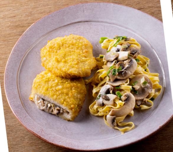
Kip champignons , gepaneerde voorgegaarde kip gevuld met romige champignonvulling. Poulet champignons , poulet pané, précuit, farci d'une sauce crémeuse aux champignons. 10824320 — 125 g st/pc — 2 x 12 st/pc — 3kg 10824220 — 125 g st/pc — 8 x 2 st/pc — 2kg