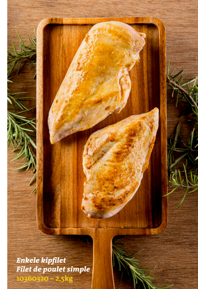
Enkele kipfilet Filet de poulet simple 10360320 – 2,5kg

Verse kippendelen, topkwaliteit van Maiski.