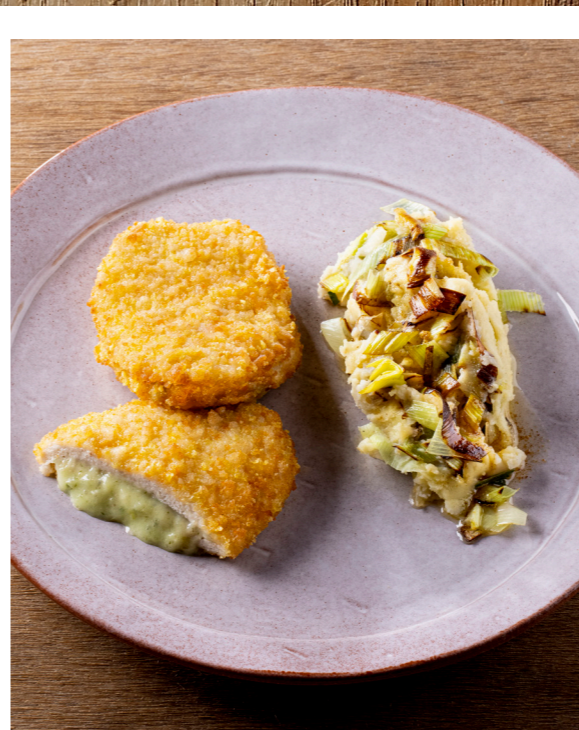
Kip kaas prei , gepaneerde voorgegaarde kip gevuld met kaassaus en stukjes prei. Poulet fromage poireau , poulet pané, précuit, farci d'une sauce au fromage et au poireau. 10833320 — 125 g st/pc — 2 x 12 st/pc — 3kg