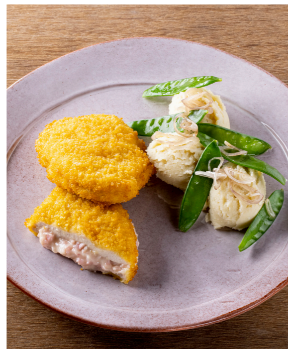
Kip ham en kaas , gepaneerde voorgegaarde kip met een romige kaasvulling en hamblokjes. Poulet jambon/fromage , poulet pané, précuit, farci d'une sauce crémeuse au fromage et jambon. 10827320 — 125 g st/pc — 2 x 12 st/pc — 3kg 10827220 — 125 g st/pc — 8 x 2 st/pc — 2kg