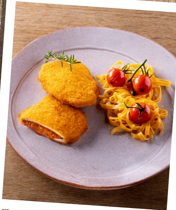
Kip Italiaans , gepaneerde voorgegaarde kip gevuld met pittig gekruide tomatensaus. Poulet à l'italienne , Poulet pané, précuit, farci d'une sauce tomate épicée. 10821320 — 125 g st/pc — 2 x 12 st/pc — 3kg 10821220 — 125 g st/pc — 8 x 2 st/pc — 2kg