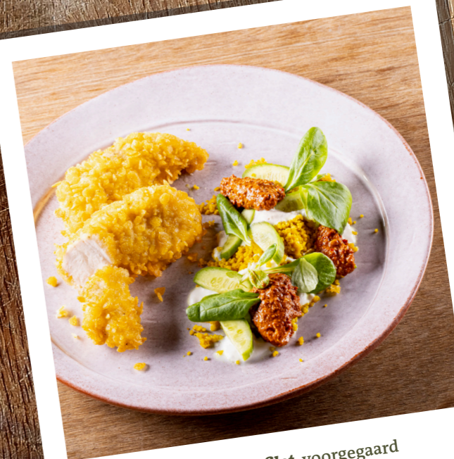
Kippenhaasje van verse filet , voorgegaard en krokant gepaneerd Aiguillette de poulet frais , panées et précuites 10857320 — 70 g st/pc — 35 st/pc — 2,5kg