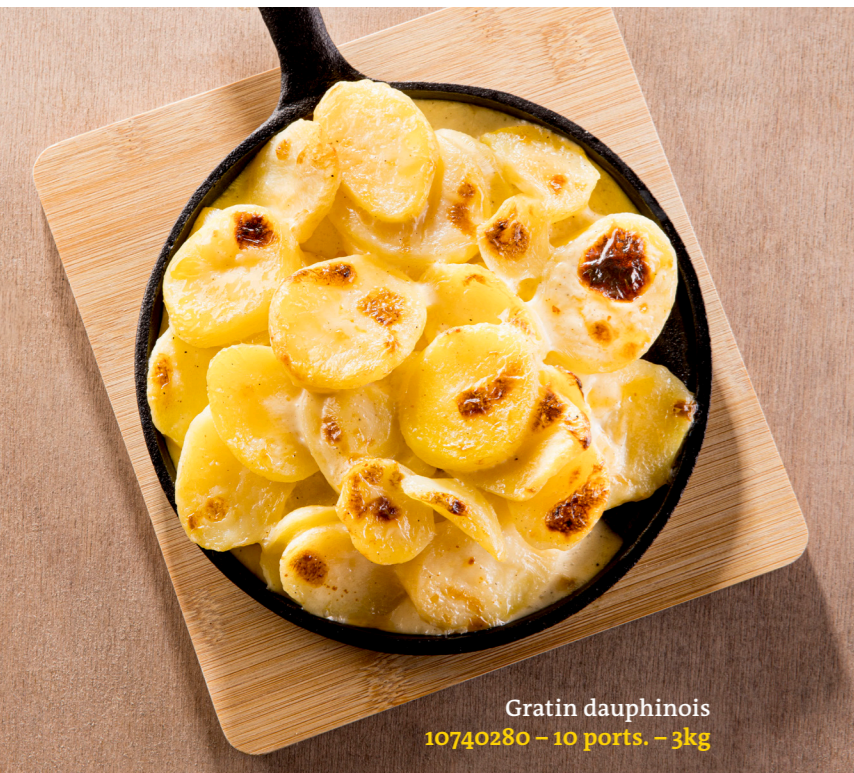
Gratin dauphinois 10740280 – 10 ports. – 3kg

Découvrez et dégustez les gratins Maiski. Nous gratins se composent des meilleures tranches de pommes de terre et de légumes cuits croustillants. Garnis d'une sauce crémeuse et des épices délicieuses.