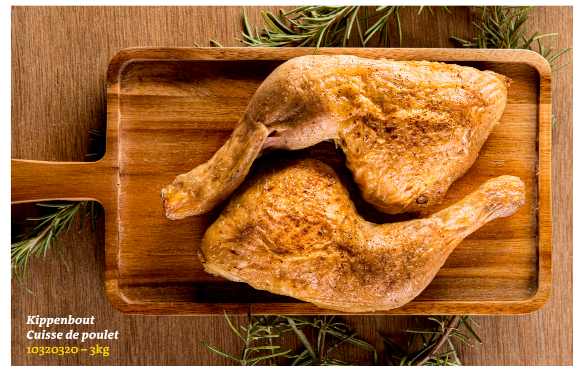
Kippenbout Cuisse de poulet 10320320 – 3kg

Précul, délicieusement assaisonné et idéal pour réchauffer dans le four, air chaud ou le BBQ.