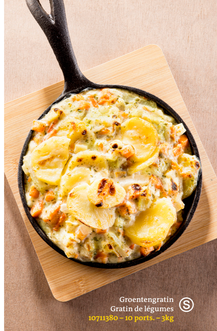
Groentengratin Gratin de légumes 10711380 – 10 ports. – 3kg