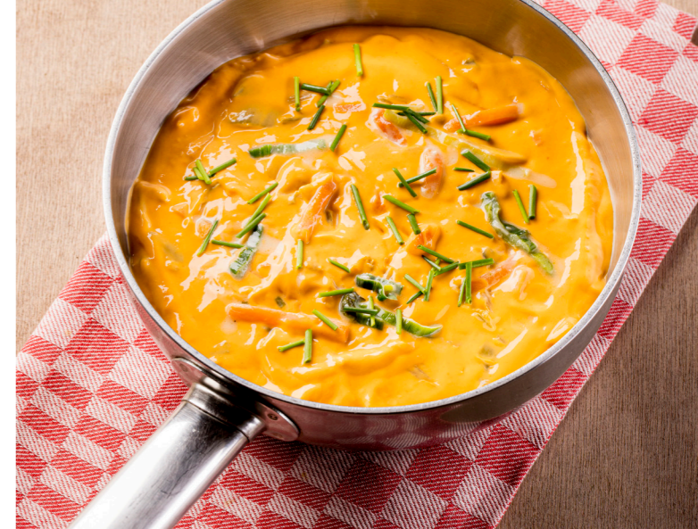
Vissaus , hier afgewerkt met extra bieslook Sauce poisson , fini ici avec ciboulette 10720350 – 46 ports. – 2,3kg

Nos sauces contiennent les meilleurs ingrédients sélectionnés par nos développeurs pour être à la hauteur des standards Maiski. Les sauces se réchauffent facilement et se conservent pendant longtemps.