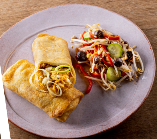
Loempia Thai , sojascheuten, kip en groenten in een knapperig deeg. Loempia Thai , germes de soja, poulet et des légumes dans une crêpe croustillante. 10823320 – ±180 g x 10 – 1,8kg