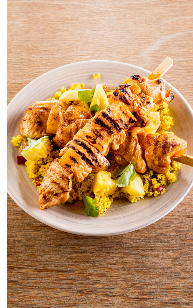
Kipfiletbrochette met ananas Brochette de filet de poulet à l'ananas 10876322 – 10 st/pc – 150 g – 1,5kg