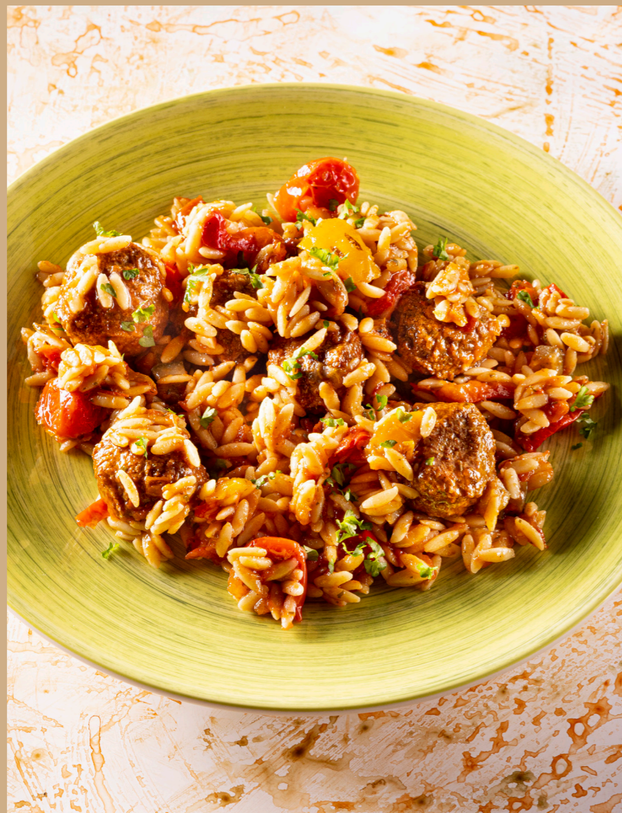
Orzo met vegetarische balletjes en gegrilde groenten Orzo aux boulettes végétales et légumes grillés 10713280 – 7 à 8 pors – 3kg