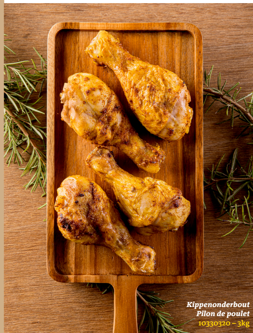
Kippenonderbout Pilon de poulet 10330320 – 3kg