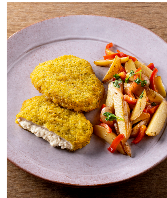
Kip smeltkaas 'La vache qui rit' , gepaneerde voorgegaarde kip gevuld met de romige smeltkaas 'La vache qui rit'. Poulet fromage fondu , 'La vache qui rit'. Poulet pané, précuit, farci au fromage fondu crémeux 'La vache qui rit'. 10822320 — 125 g st/pc — 2 x 12 st/pc — 3kg 10822220 — 125 g st/pc — 8 x 2 st/pc — 2kg