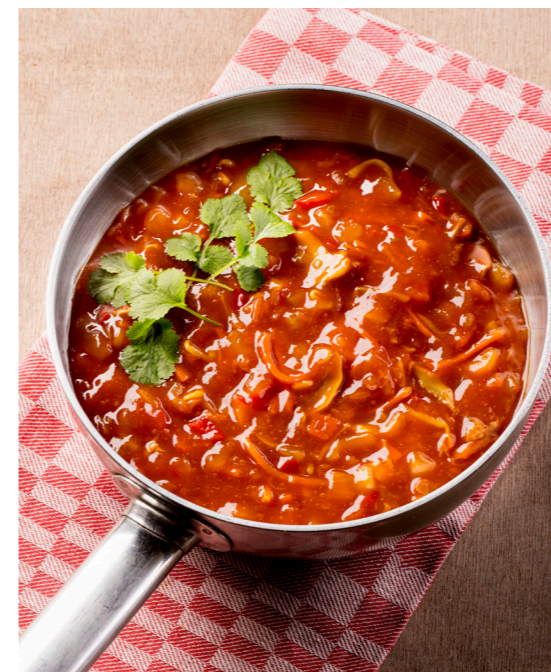
Oriëntaalse saus , hier afgewerkt met verse koriander Sauce orientale , fini ici avec coriandre frais 10721650 – 46 ports. – 2,3kg