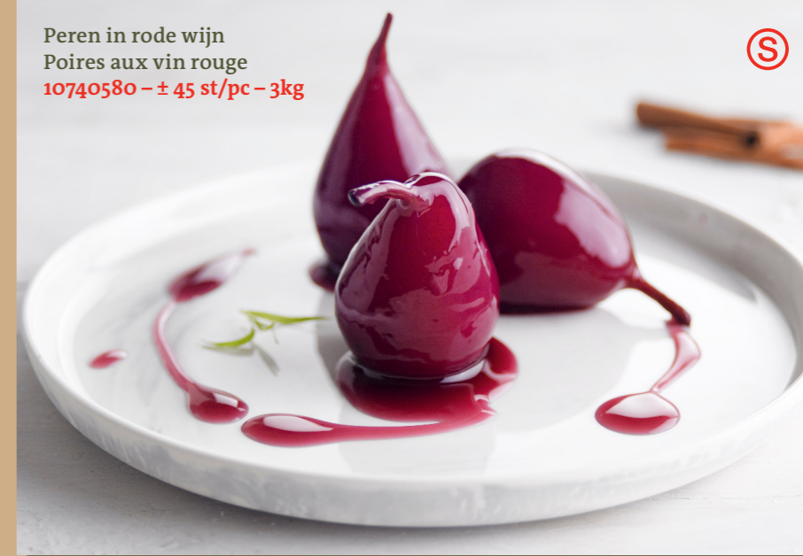
Peren in rode wijn Poires aux vin rouge 10740580 – ± 45 st/pc – 3kg

Les préparations chaudes de fruits font partie intégrante de vos préparations hivernales et de la cuisine de gibier. Chez Maiski, nous avons élaboré un assortiment à base des meilleures pommes et poires.