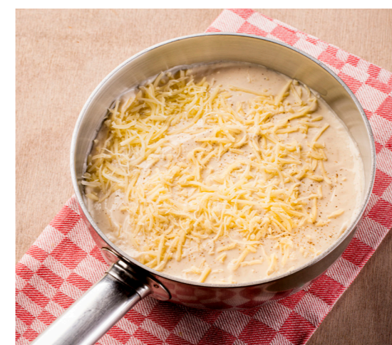
Kaassaus , extra af te werken met geraspte of smeltkaas naar uw keuze Sauce au fromage , à finir éventuellement avec fromage rapé ou fromage à fondre, à votre choix 10720150 – 46 sports. – 2,3kg