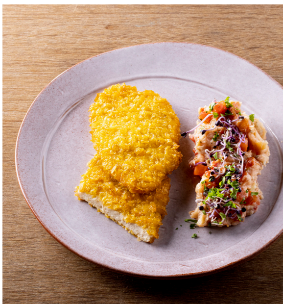
Krokantschnitzel , voorgedaarde kip gepaneerd met cornflakes. Schnitzel croustillant poulet précuit , pané de cornflakes. 10813320 – 125 g st/pc – 2 x 10 st/pc – 2,5kg