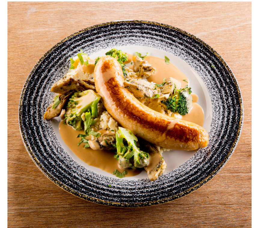
Kipworst 150g Saucisse de poulet 150g 10820320 – 20 st/pc – 3kg