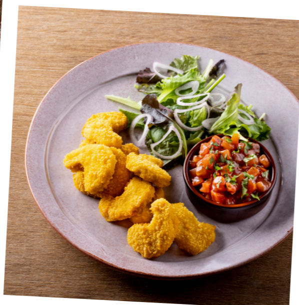
Kip nuggets , gepaneerde mini snack van kippenvlees. Nuggets de poulet , mini snack de viande de poulet panée. 10836320 – 20 g st/pc – 2,7kg