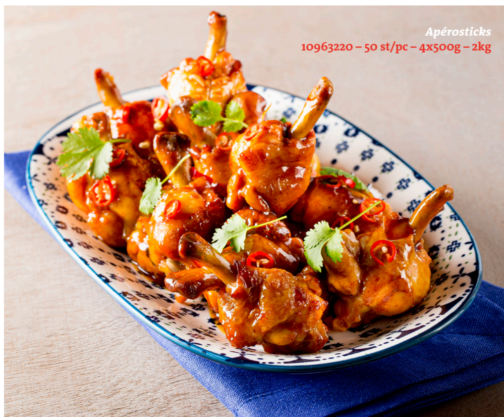
Apérosticks 10963220 – 50 st/pc – 4x500g – 2kg

Voorgegaard, lekker gekruid en perfect te regenereren, in de oven, hetelucht of de BBQ.