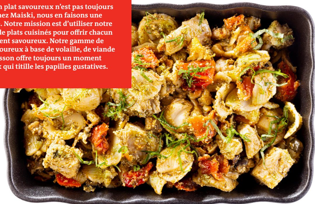
Pasta met pesto en kip (warm of koud) Pâtes au pesto et poulet (chaud ou froid) 10712480 - 7 à 8 ports. - 3kg