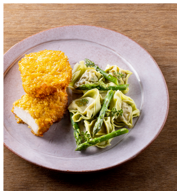
Kip krokantschnitzel , kippenlapje gepaneerd met cornflakes. Poulet croustillant , poulet pané de cornflakes. 10810220 – 125 g st/pc – 8 x 2 st/pc – 2kg