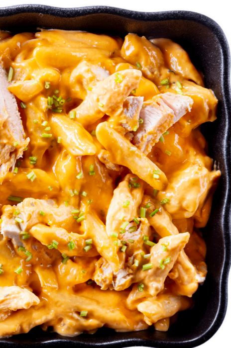
Mini-penne met kip in mascarponesaus Mini penne au poulet et sauce mascarpone 10713380 7 à 8 ports - 3kg