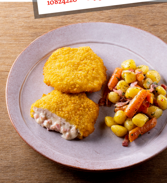
Kip cordon bleu , gepaneerde voorgegaarde kip gevuld met een romige kaasvulling en hamblokjes. Poulet cordon bleu , poulet pané, précuit, farci d'une sauce crémeuse au fromage et jambon. 10817320 — 150 g st/pc — 2 x 10 st/pc — 3kg 10817220 — 150 g st/pc — 8 x 2 st/pc — 2,4kg