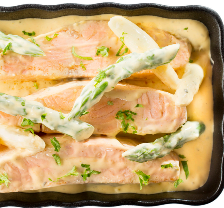
Zalm met duo van asperges Saumon avec duo d'asperges 10713180 - 10 ports. - 3kg